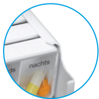
weiß: PZN 03812431

3 verschiedene Farben stehen Ihnen zur Wahl: