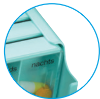
türkis: PZN 06055404