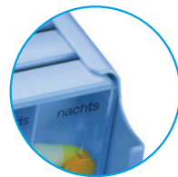
blau: PZN 03320159